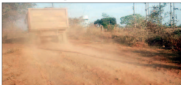
हरिभूमि न्यूज बरबसपुर

प्रदेश में विकास के दावों के बीच ग्राम बीजाड़ी, बरबसपुर और डबरामाट के ग्रामीण अब भी बुनियादी सुविधाओं के अभाव से जूझ रहे हैं। बरबसपुर से डबरामाट तक जाने वाली मुख्य सड़क वर्षों