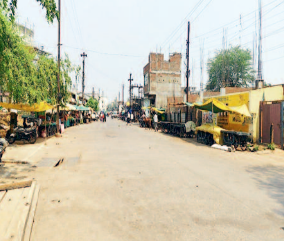
हरिभूमि न्यूज कवर्धा

धीषण गर्मी के बीच शहर के प्रमुख मार्गों पर पेयजल की समुचित व्यवस्था नहीं होने से राहगीरों और छोटे व्यापारियों को भारी परेशानी का सामना करना पड़ रहा है। शहर के व्यस्ततम क्षेत्रों में सार्वजनिक प्याऊ की कमी साफ तौर पर महसूस की जा रही है, जिससे लोगों को प्यास बुझाने के लिए भटकना पड़ रहा है।