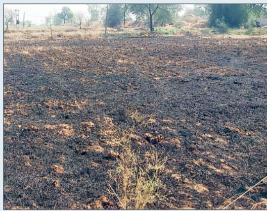
उर्वरता पर गंभीर प्रतिकूल

प्रशासन द्वारा पूर्व में किसानों से अपील की गई थी कि फसल अवशेषों को जलाने के बजाय उनका उपयोग पशुओं के चारे के रूप में करें अथवा गौशालाओं को दान दें। इसके बावजूद वर्तमान में कई स्थानों पर पराली दहन की घटनाएं लगातार सामने आ रही हैं। ग्रामीणों से मिली अनुसार के अनुसार खेतों में लगाई गई जाग कई बार अनियंत्रित होकर दूर तक फैल जाती है, जिससे आसपास के पेड़-पौधे और अन्य फसलों भी इसकी चपेट में आ जाती हैं। इससे आगजनी की घटनाओं का खतरा बढ़ गया है और किसानों को अतिरिक्त नुकसान उठाना पड़ रहा है। कृषि विभाग ने भी इस पर चिंता