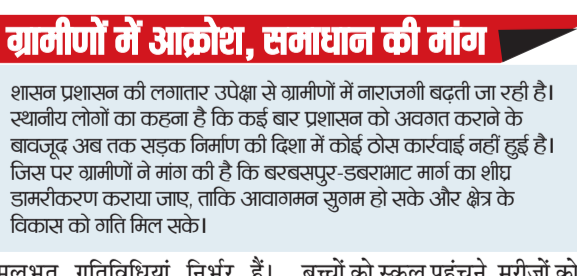
हरिभूमि न्यूज बरबसपुर

प्रदेश में विकास के दावों के बीच ग्राम बीजाड़ी, बरबसपुर और डबरामाट के ग्रामीण अब भी बुनियादी सुविधाओं के अभाव से जूझ रहे हैं। बरबसपुर से डबरामाट तक जाने वाली मुख्य सड़क वर्षों