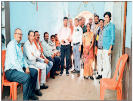
पिपरिया। भारत के महा रजिस्ट्रार एवं जनगणना आयुक्त भारत सरकार नई दिल्ली के निर्देशानुसार तथा कबीरधाम जिले के